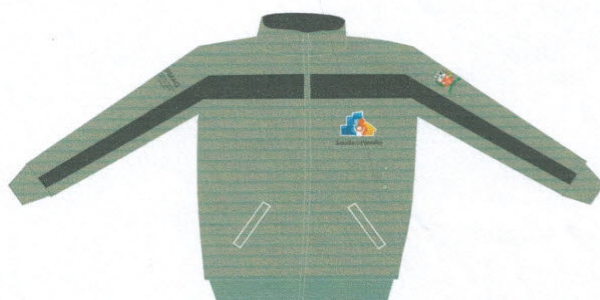
JAQUETA MALHA COLEGIAL APELUCIADA C/ BORDADOS