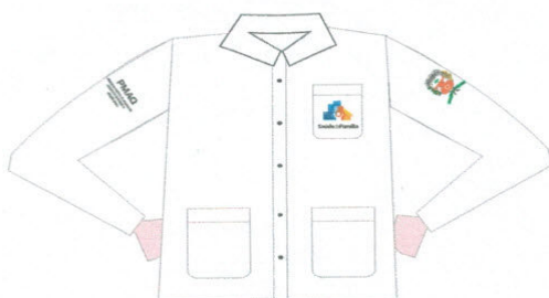
JALECO SELETEL 3/4 C/ BORDADOS