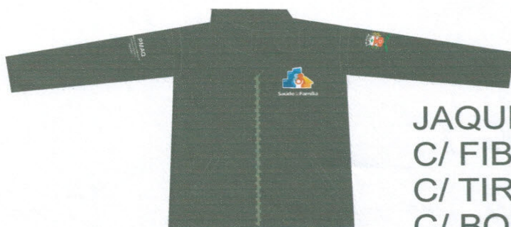
JAQUETA MONTREAL C/ FIBRA C/ TIRA MANGAS C/ BORDADOS