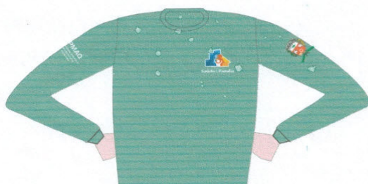
CAMISETA PV CHUMBO OU VERDE OLIVA C/ BORDADOS